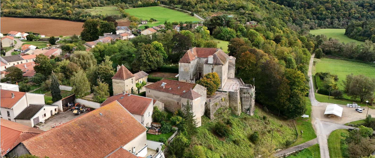
Château de Jaulny (54)