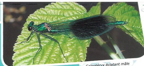
Caloptéryx éclatant mâle

De février à juin 2011, 7 classes des écoles de la vallée du Rupt-de-Mad ont été invitées à découvrir le monde surprenant des insectes (groupes scolaires de Essey-et-Maizerais, Thiaucourt, Rembercourt, Waville, Arnaville). Les informations collectées par les écoliers participent à une meilleure connaissance de la faune et de la flore de la vallée et peuvent donc enrichir les actions d'entretien ou de restauration menées par la Communauté de communes. Une nouvelle thématique est prévue pour l'année prochaine, toujours avec l'appui de la Maison de l'Environnement du conseil général.