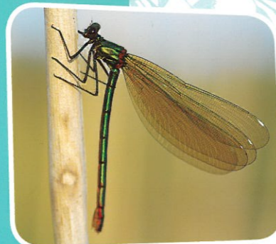
Caloptéryx éclatant femelle