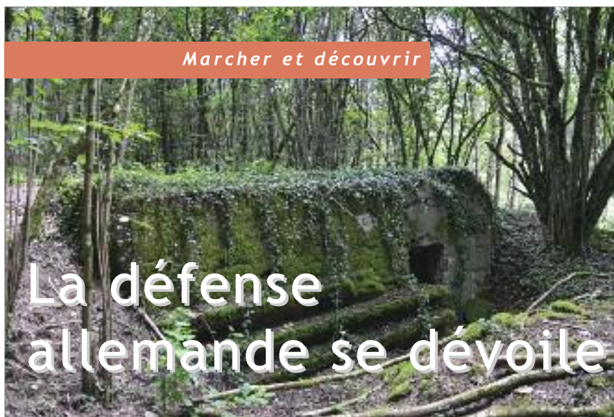
Entrée d'une fortification