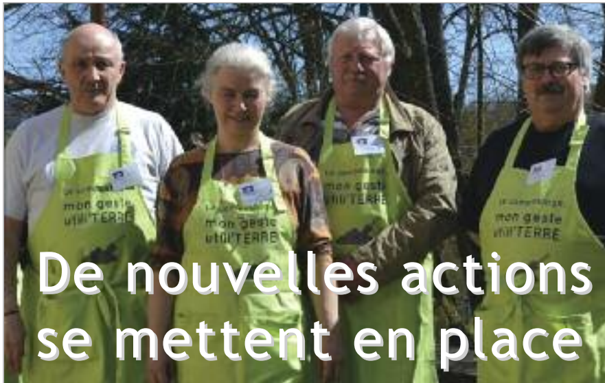
L'équipe de guides-composteurs