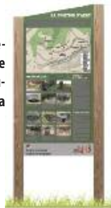
Exemple de panneau touristique