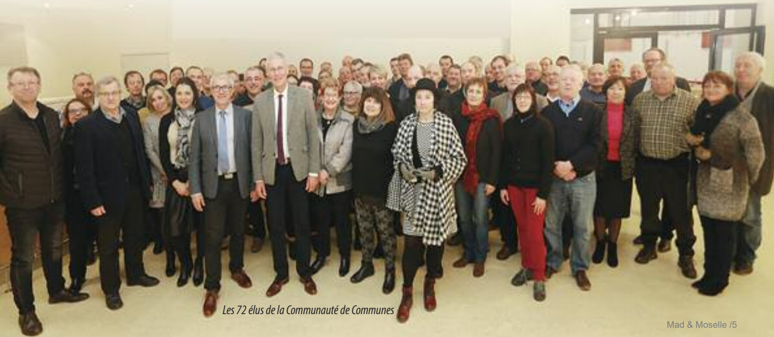
Les 72 élus de la Communauté de Communes

Communauté de Communes Mad & Moselle - 2 bis rue Henri Poulet - 54470 Thiaucourt accueil@cc-madetmoselle.fr