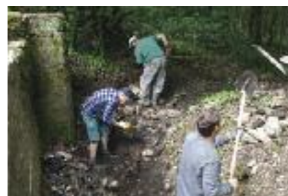
Travaux de déblaiement