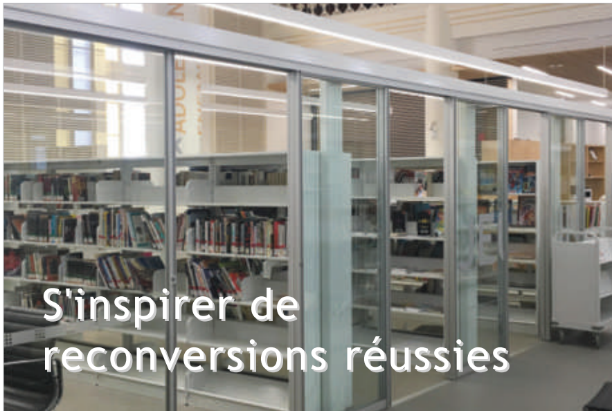
Bibliothèque Félicité-Angers. Un lieu de cohabitation entre culte et culture à Neuville, Québec

Les églises constituent un patrimoine important à la charge des communes. Edifice dédié au culte mais aussi patrimoine historique, marqueur identitaire de nos communes, beaucoup d'élus se questionnent sur le devenir de ces édifices, notamment face à la diminution de la pratique religieuse. Ainsi, la CCMM, en concertation très étroite avec les élus communaux et leurs habitants, a souhaité organiser un débat à l'échelle du territoire sur les hypothèses de réaffectation des églises en lien avec les besoins locaux.