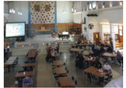
Le Chic resto pop. Une église pour nourrir une communauté à Montréal, un organisme d'insertion et d'économie sociale qui sert des repas abordables à la communauté défavorisée du quartier.

Le Canada, l'Espagne, les Pays-Bas ont produit de nombreux exemples de réaffectation d'édifices religieux qui ont donné jour à des lieux culturels, artistiques ou associatifs contribuant ainsi à préserver leur patrimoine historique et dynamiser le développement de leur territoire.