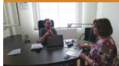
Permanence à Ancy-Dornot

L'association Camel (Collectif pour l'Amélioration Énergétique du Logement) a été désignée pour animer l'opération. Camel, spécialisée dans l'accompagnement et le conseil aux particuliers pour des travaux d'amélioration de l'habitat, est en charge de répondre aux sollicitations des habitants du territoire, de les conseiller dans leurs projets de travaux et de les accompagner dans leurs demandes de subvention et leurs démarches administratives.