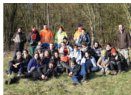
Les 40 étudiants qui ont œuvré sur les deux chantiers, accompagnés par 3 agents de Mad & Moselle

Après deux ans de travail, de concertation et la participation de nombreux acteurs du territoire, le plan de paysage arrive aujourd'hui à son terme ! Il ne reste plus qu'à le proposer officiellement à l'avis des conseillers communautaires très prochainement.