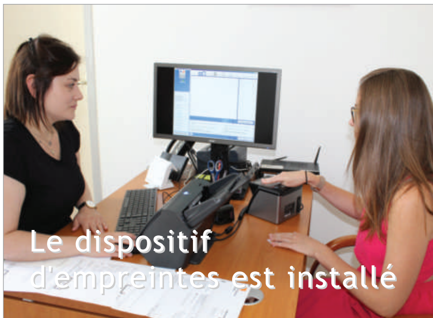
Emine Us vous accueille à la Maison de services au public à Thiaucourt