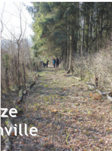
Sentier réouvert entre Vandelainville et Onville en réutilisant les végétaux sur site, telle que la technique du pleassage