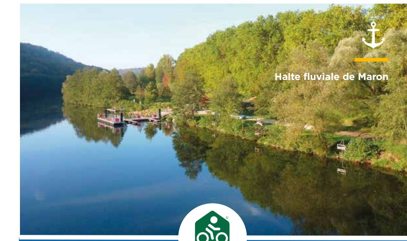
Halte fluviale de Maron