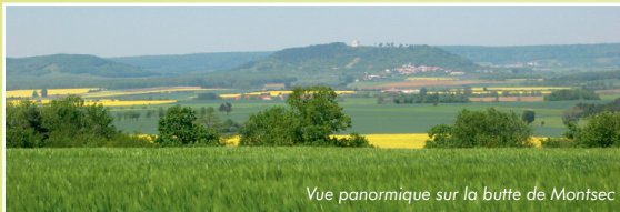
Vue panoramique sur la butte de Montsec