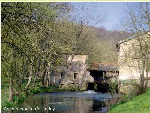
Ancien moulin de Jaulny

Dominant la vallée du Rupt-de-mad, le château fut dès le XI e siècle une place stratégique. Il reste aujourd'hui le témoin le plus ancien et le mieux conservé de la Lorraine féodale avec un donjon en forme de U où vivaient le seigneur et sa famille. Il abrite les portraits de Jeanne et Robert des Armoises, alias Jeanne D'Arc, une salle des gardes, une salle aux portraits, un petit salon, des collections de faïences et porcelaines... Le château dispose de chambres d'hôtes et de gîtes, ouverts tout au long de l'année. Il accueille de nombreux scolaires qui viennent revivre au temps du Moyen-Age et participer à des ateliers pédagogiques (calligraphie, enluminure, tir à l'arc...).