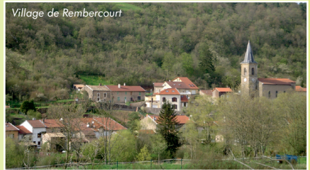
Village de Rembercourt