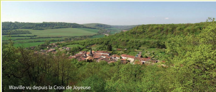
Waville vu depuis la Croix de Joyeuse

Un petit circuit concentré en découvertes !