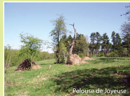
Pelouse de Joyeuse

Situé en bordure d'un coteau abrupt de la vallée du Rupt de Mad et hérité de pratiques pastorales ancestrales, ce milieu semi ouvert présente une biodiversité remarquable. La faible épaisseur des sols calcaires, le manque d'eau et l'exposition plein sud en font un habitat idéal pour de nombreuses espèces thermophiles rares et protégées. On y trouve donc plusieurs animaux et plantes généralement propres au milieu méditerranéen : Vipère aspic, Léopard des souches, Caloptène italien (criquet), et autres orchidées comme l'Ophrys abeille ou l'Epipactis de Müller. Ce sont des milieux fragiles, merci de les respecter et d'éviter la cueillette.