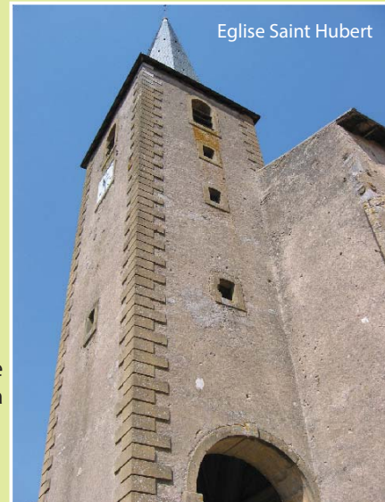
Eglise Saint Hubert